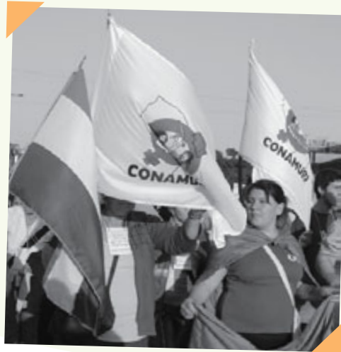
Marcha inaugural del Foro