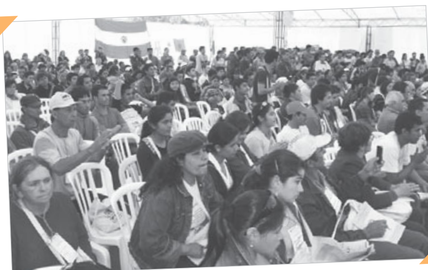
Multitud reunida bajo la carpa de la Vía Campesina