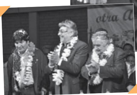
Presidentes de Bolivia, Paraguay y Uruguay