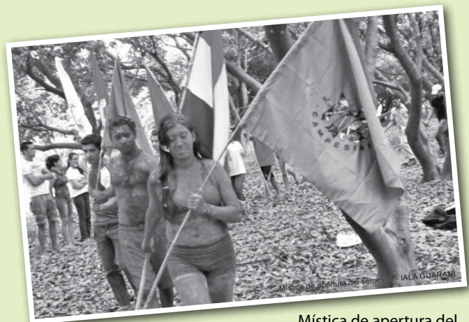
Mística de apertura del IALA Guaraní