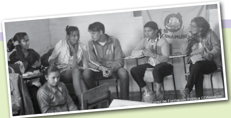
Participantes del Encuentro de Formación de Militantes