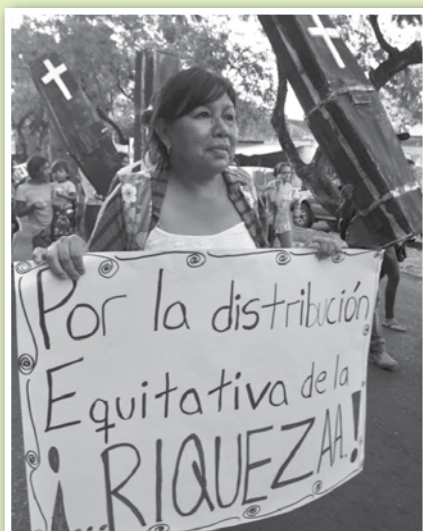
Indígenas y campesinas marcharon por el día internacional de las mujeres trabajadoras