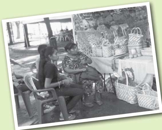
Compañeras indígenas exponiendo el fruto de su trabajo, durante la feria Jakaru Porã Haguã

Camino al 7° Congreso de Conamuri, las visitas a las bases son momentos de mística y de reflexiones