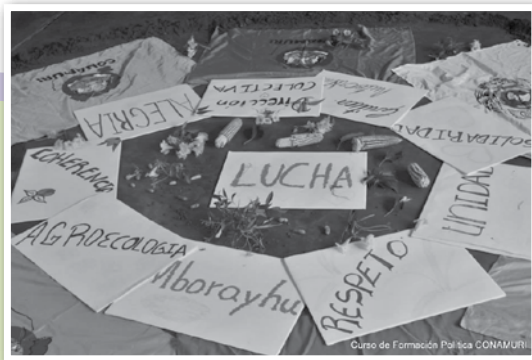
El 1° Encuentro de Formación de Militantes tuvo lugar a finales de febrero e inicios de marzo en Caaguazú