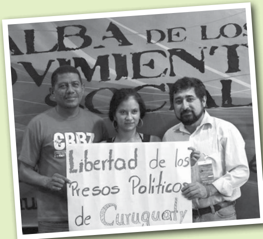
Paraguay presente en coordinación continental del ALBA de los Movimientos, Venezuela

La primera feria Jakaru Porã Haguã se realizó en la plaza Infante Rivarola