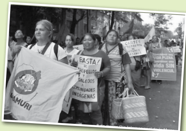
La marcha del 8 de marzo reunió a mujeres de distintos sectores de la sociedad