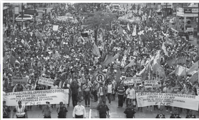
La huelga general del 26 de marzo fue una fiesta cívica que permitió visibilizar el nivel del descontento de la gente con respecto al gobierno de Horacio Cartes

Contra la APP y por la libertad de las presas y los presos políticos de Curuguaty. Paraguay en huelga general el 26 de marzo